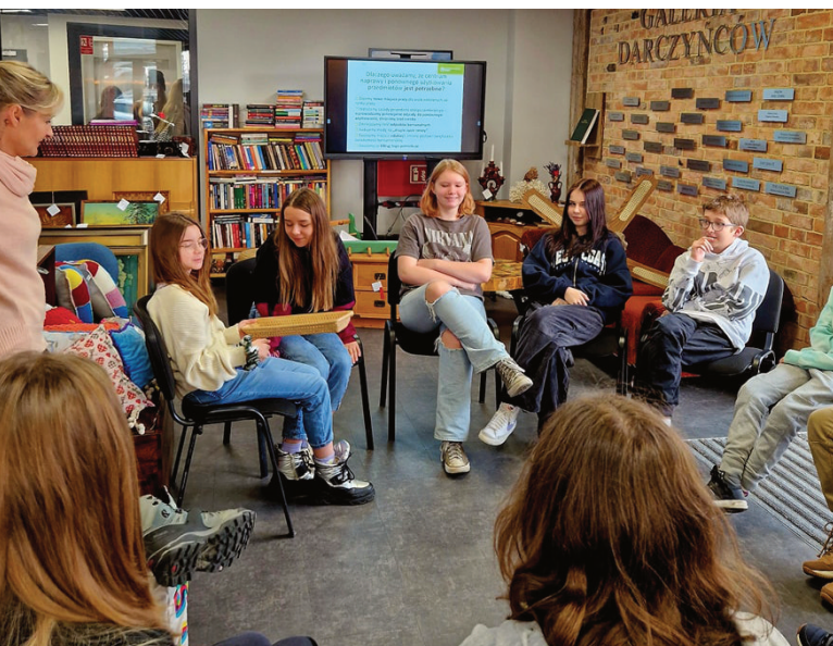
Młodzież ze spółdzielni uczniowskiej „Zgredek” gościła w Domu pod Cisem