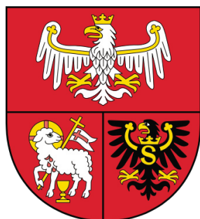
Urząd Marszałkowski Województwa Warmińsko-Mazurskiego

Wymiana doświadczeń, wspólne działania, a także wspólna realizacja projektów - bez naszych partnerów nie byłoby to możliwe!