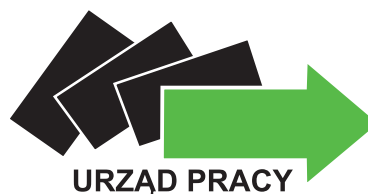
Powiatowy Urząd Pracy w Elblągu