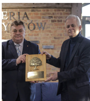
Witold Wróblewski Prezydent Elbląga