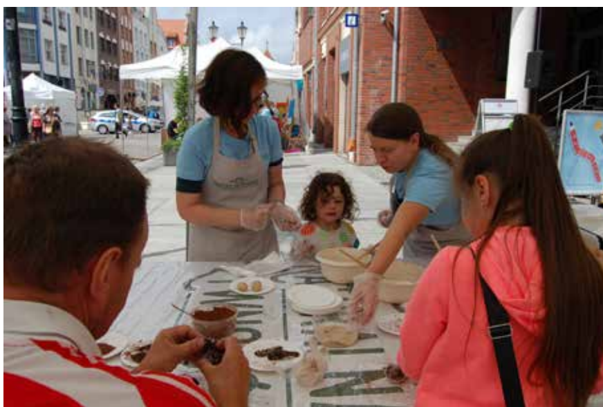
Warsztaty kulinarne przedsiębiorstwa społecznego „Naturalna Żywność”

Godziny, odmierzane uderzeniami katedralnego dzwonu i kolejnymi opadami deszczu upłynęły szybko. Uczestnicy Targów zabrali do domu wiele przyjemnych wrażeń, inspiracji i nowych wiadomości, zapewniając, że ponownie spotkają się za rok.