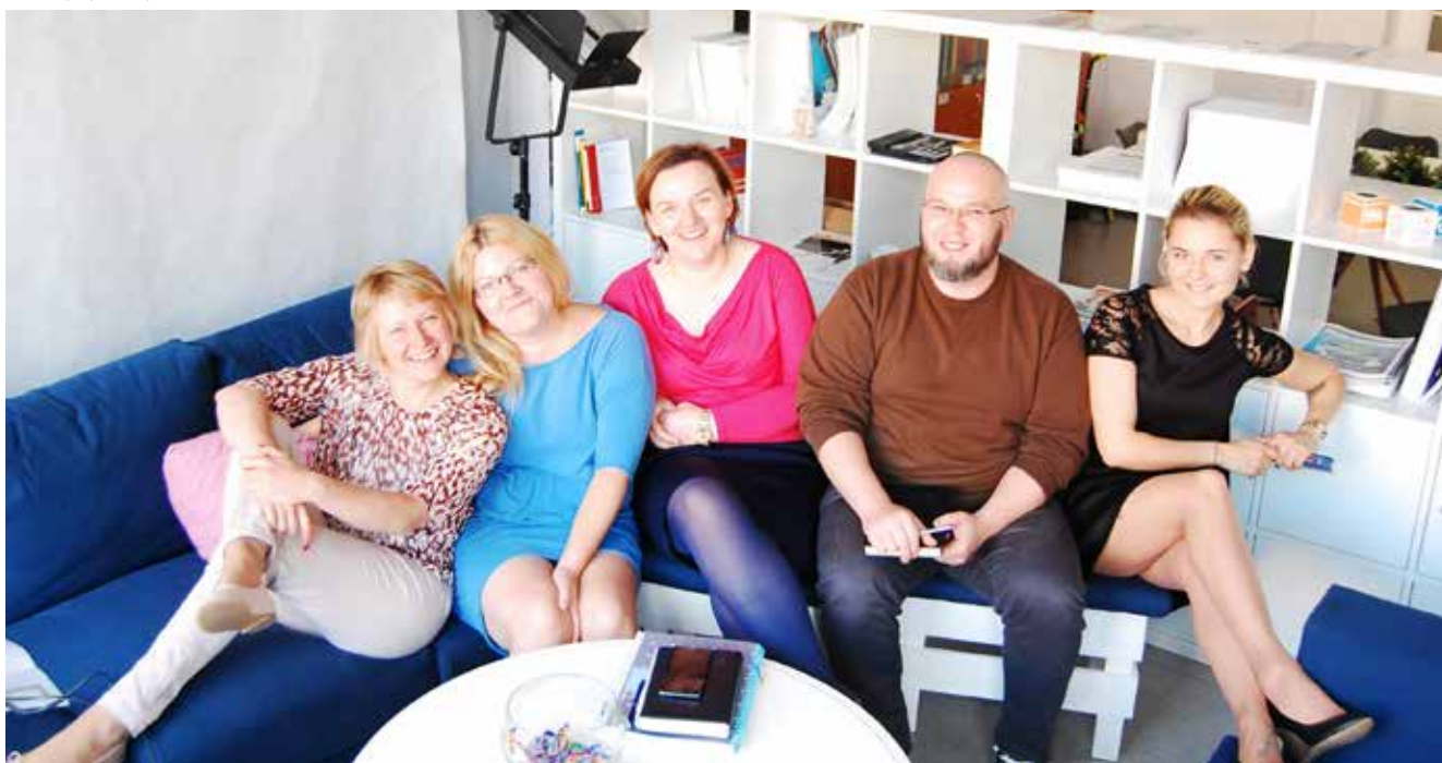
Zespół elbląskiego Centrum Organizacji Pozarządowych

Każdy z nas wie jak to jest, kiedy upływające terminy nie dają spać a, jak na złość, kot ciągle domaga się pieśszcota i pełnej miski, komórka co chwilę wysyła nie-pozytywne wibracje, a wiertarka