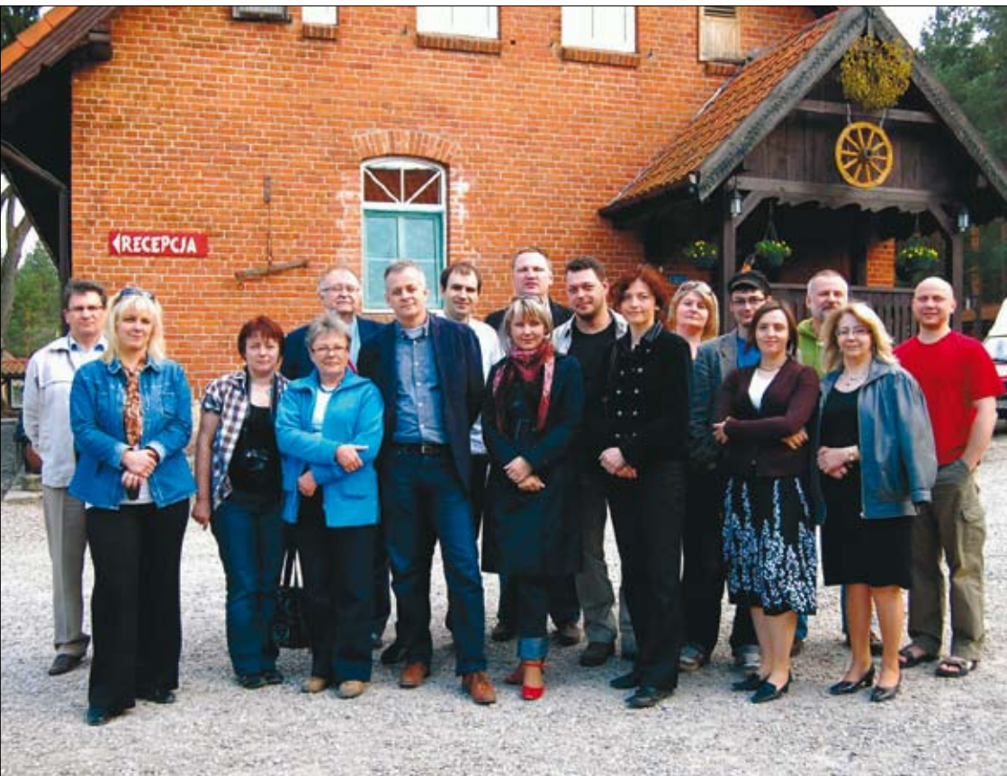
Autorzy „Standardu powiatowego Centrum Organizacji Pozarządowych”, wypracowanego w 2009 roku