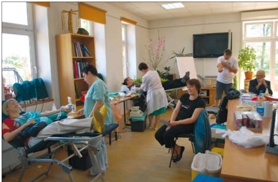
Akcja oddawania krwi podczas Elckiej Majówki Pozarządowej