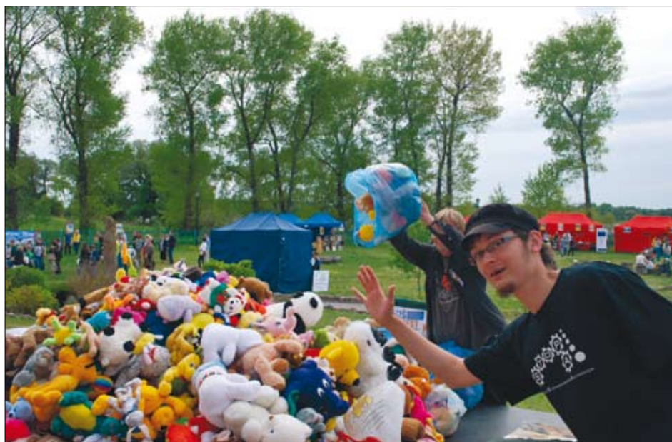
Akcja „MAŁY miś WIELKI gest” przeprowadzana podczas Elckiej Majówki Pozarządowej współorganizowanej przez COP