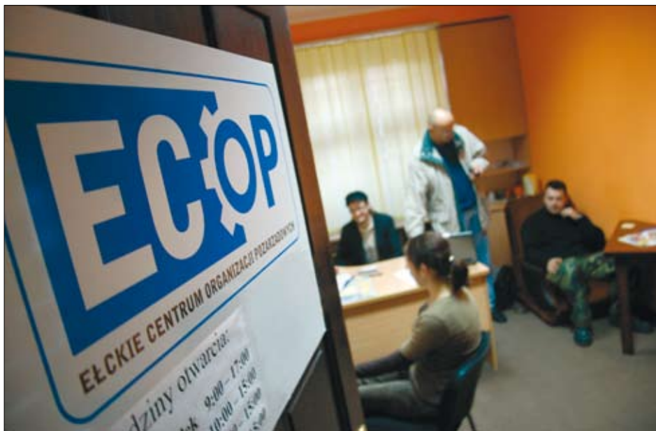
Biuro elckiego COP-u