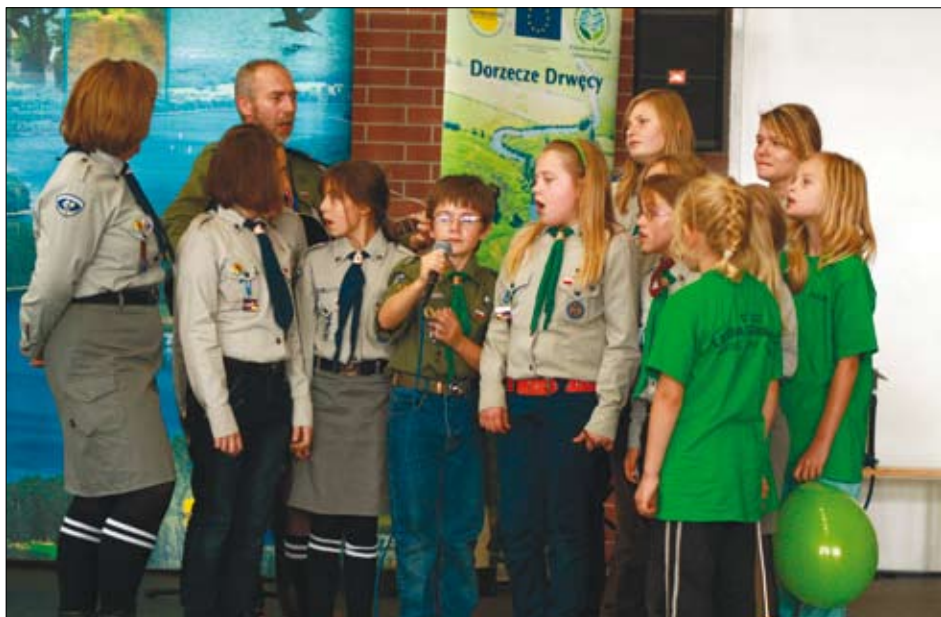
Najmłodszy uczestnicy Forum Inicjatyw Pozarządowych współorganizowanego przez iławski COP