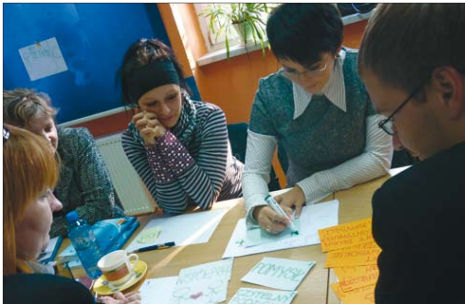
Warsztaty organizowane przez COP w Ilawie