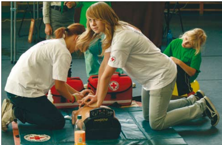
Uczestniczki Forum Inicjatyw Pozarządowych współorganizowanego przez iławski COP