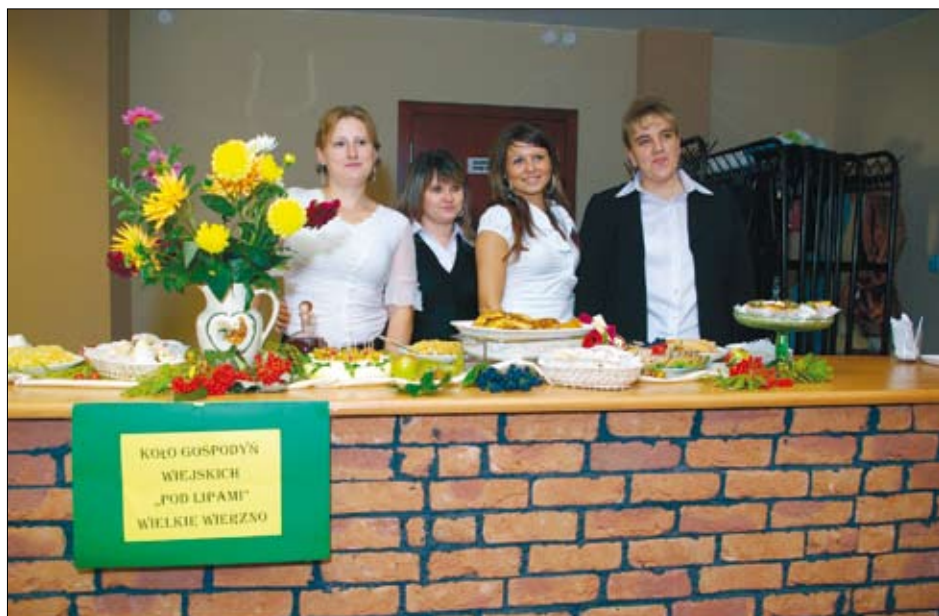
Uczestniczki Forum Inicjatyw Pozarządowych organizowanego przez braniewski COP