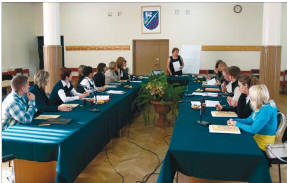
Szkolenie organizowane przez braniewski COP