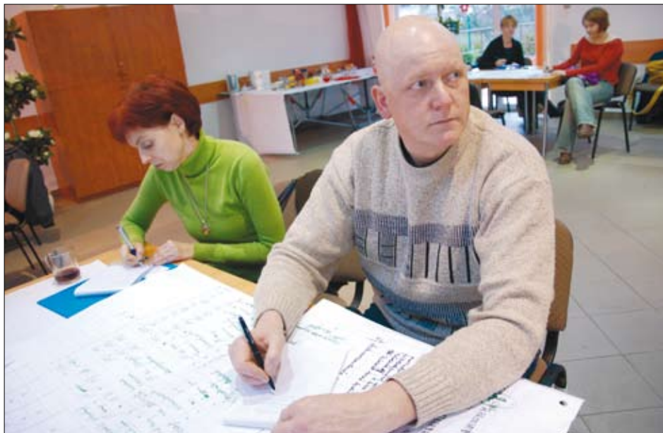
Uczestnicy szkolenia organizowanego przez braniewski COP