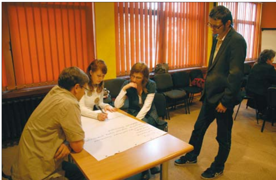
Szkolenie organizowane przez elcki COP