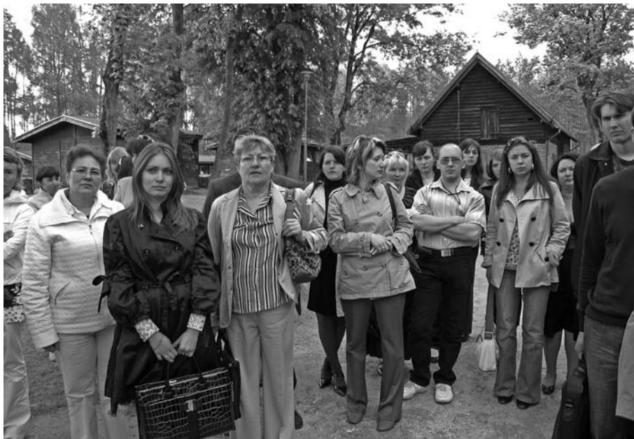
Wizyta studyjna Rosjan w Polsce w ramach projektu „Aktywna współpraca”, maj 2008 r.