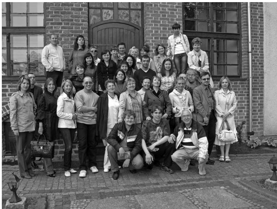
Wizyta studyjna Rosjan w Polsce w ramach projektu „Aktywna współpraca”, maj 2008 r.