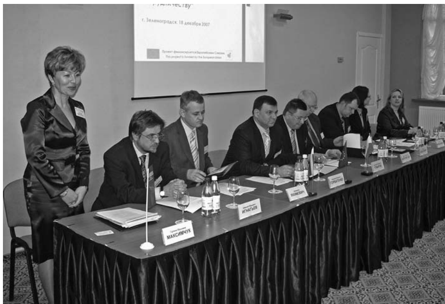
Konferencja otwierająca projekt „Aktywna współpraca”, Zielonogradzk 2007 r.