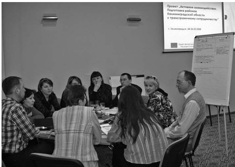
Szkolenie w ramach projektu „Aktywna współpraca”, Zielenogradzk 2008 r.