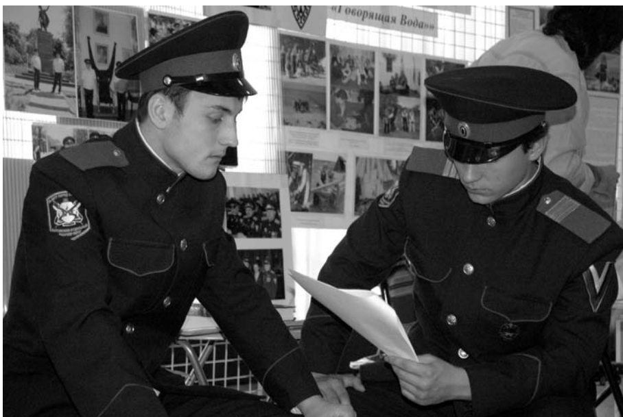
Uczestnicy III Wystawy Organizacji Pozarządowych w Kaliningradzie, wrzesień 2007 r.

Głównym celem projektu był rozwój społeczeństwa obywatelskiego w Rosji opartego na świadomej, uczestniczącej w życiu społecznym i kulturowym młodzieży. Dotykał on również niezwykle istotnej sfery współpracy transgranicznej w wymiarze młodzieżowym.