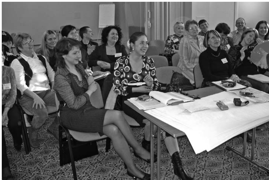
Szkolenie w ramach projektu „Aktywna współpraca”, Zielenogradzk 2008 r.

Organizator: Muzeum Kultury Ludowej w Węgorzewie (52), Urząd Miejski w Węgorzewie (53), Powiat Węgorzewski (55) Miejsce: Czerniachowski Termin: 27–29 czerwca