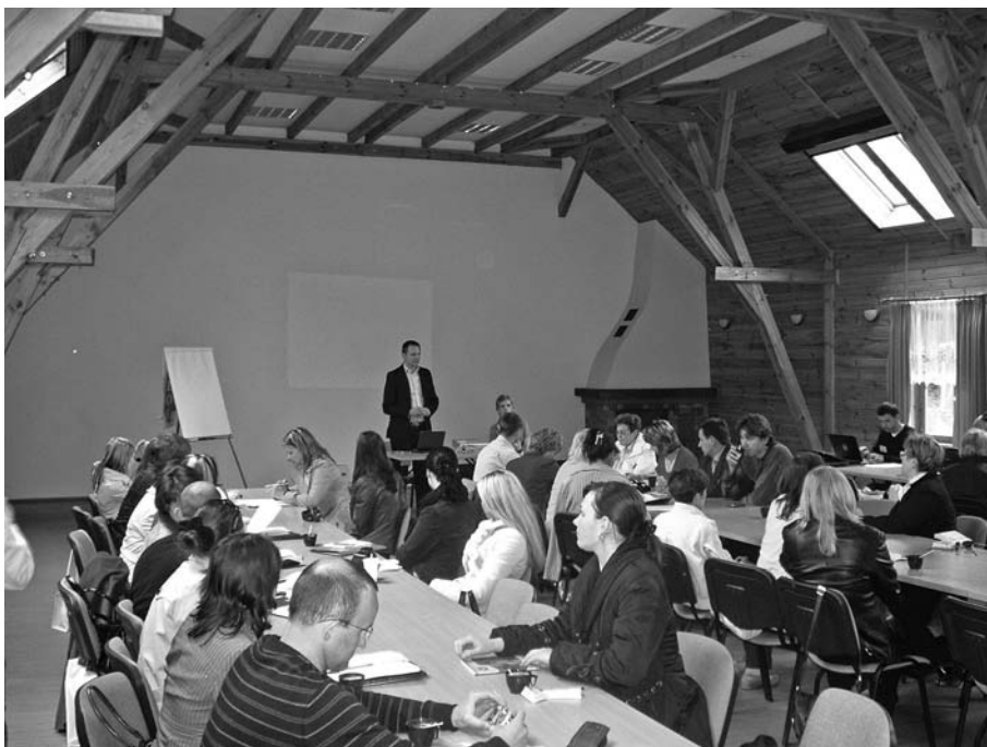
Wizyta studyjna Rosjan w Polsce w ramach projektu „Aktywna współpraca”, maj 2008 r.