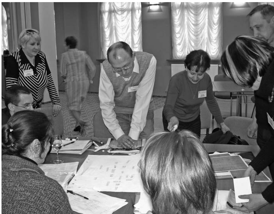
Szkolenie w ramach projektu „Aktywna współpraca”, Zielenogradzk 2008 r.