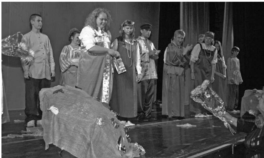
Forum Organizacji Pozarządowych w Kaliningradzie, wrzesień 2007 r.