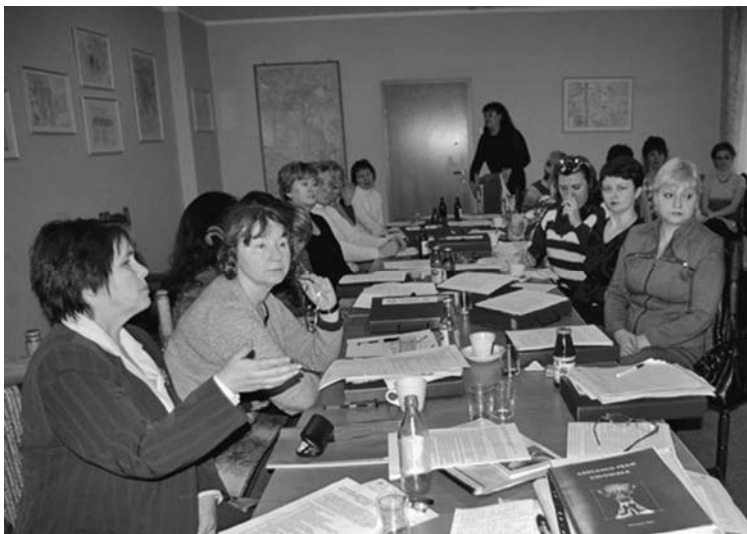
Warsztaty w ramach projektu „Dzieciństwo bez przemocy”

Dzieciństwo jako najpiękniejszy okres życia nie może być naznaczone przemocą fizyczną czy psychiczną. Prawo dziecka do życia w środowisku wolnym od przemocy i wzrastanie w poczuciu miłości i godności jest prawem niezbywalnym, zagwarantowanym w podpisanej przez Polskę „Konwencji o Prawach Dziecka”. Jednakże przemoc wobec dzieci jest, mimo to, jednym z najważniejszych problemów społecznych – tak w naszym kraju, jaki i kraju naszych partnerów, Rosji – wymagającym podjęcia zorganizowanego interdyscyplinarnego planu przeciwdziałania i pomocy ofiarom, a zwłaszcza bezbronnym dzieciom.