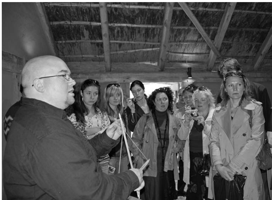
Wizyta studyjna Rosjan w Elblągu 21.05.2008 r.

W ramach projektu zostanie zrealizowany cykl 7 trzydniowych szkoleń dla każdej z dwóch grup uczestników. Szkolenia będą poświęcone tworzeniu projektów, zarządzaniu projektami, tworzeniu strategii rozwoju, współpracy międzysektorowej w Polsce i Rosji, tworzeniu partnerstw transgranicznych, umiejętnościom pracy z ludźmi, prowadzeniu doradztwa, komunikacji oraz zasadom prowadzenia punktów konsultacyjnych, które powstaną w każdym regionie Obwodu Kaliningradzkiego po zakończeniu szkoleń. Dotychczas odbyły się 4 sesje szkoleniowe. Pierwsza z nich była poświęcona zagadnieniom związanym z metodologią tworzenia projektów, identyfikacją kluczowych problemów społeczno-gospodarczych, tworzeniem strategii rozwoju oraz analizą SWOT. Podczas drugiej sesji uczestnicy projektu uczyli się w jaki sposób definiować problemy i cele projektu poprzez tworzenie drzew problemów i celów oraz matrycy logicznej. Uzupełnieniem tego szkolenia była kolejna sesja poświęcona zasadom tworzenia projektów, przygotowaniu harmonogramu oraz budżetu