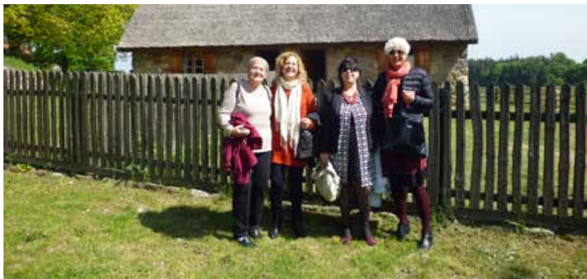
Wolontariuszki z Hiszpanii z wizytą w Skansenie w Olsztynku

w partnerstwie z Universidad Popular z Lorki. Projekt ten, realizowany w ramach programu „Uczenie się przez całe życie” akcji sektorowej Grundtvig, polega na wymianie osób w wieku 50+ z Hiszpanii oraz Polski, w celu świadczenia wolontariatu w dowolnym obszarze działalności społecznej organi-