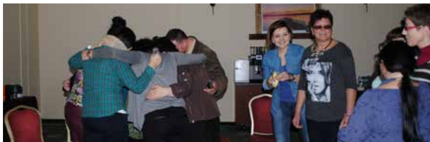
Uczestnicy Szkoły Modelu Współpracy

roku 16 osób z naszej gminy uczestniczyło w szkoleniu z komunikacji społecznej, które dało „pierwszego kopa” mówiąc kolokwialnie. Dla mnie było okazją do poznania rozterek i osobistych problemów wielu lokalnych działaczy, co też dało mi możliwość weryfikowania swojego postępowania. Chyba lepiej zaczęliśmy się rozumieć. Mi z kolei zależało, by demontować stereotypy urzędnika, które bardzo utrudniały mi relacje.