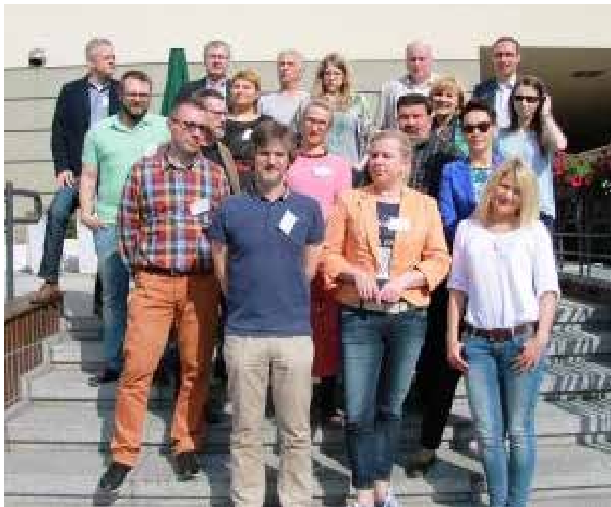
Uczestnicy posiedzenia Krajowego Panelu Ekspertów

Na początku zebrani zastanawiali się jak wobec takiej różnorodności wniosków, w tym sprzecznych ze sobą, dokonać właściwego wyboru. Stwierdzono, że ostatecznie to KPE musi wziąć na siebie odpowiedzialność za taki, a nie inny wybór. Z gąszczu uwag konsulta-