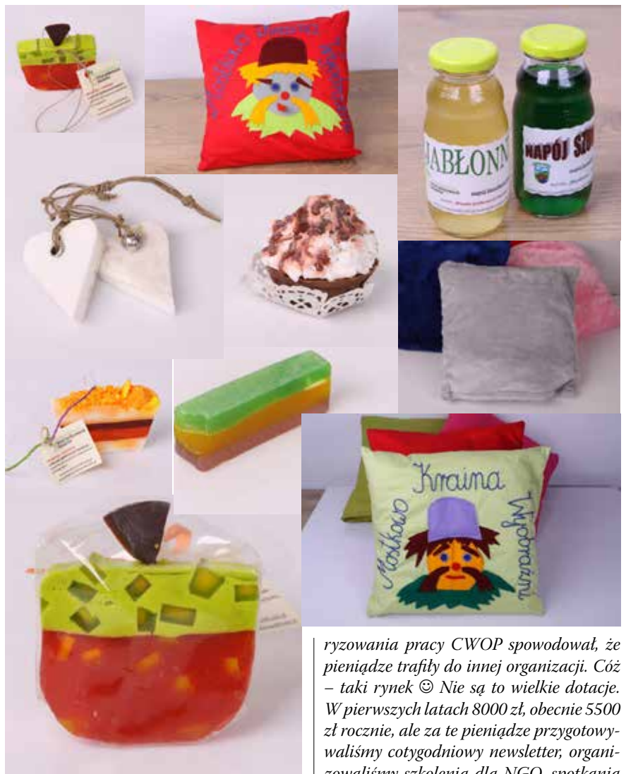
Lokalne produkty turystyczne

MH: To prawda. Te cztery lata to czas niezłego tempa. Ze względu na to, że wśród założycieli organizacji były osoby o sporym doświadczeniu w projektach, to już po pół roku mieliśmy budżet ponad 60 000 zł i pierwsze projekty. Nie tylko na prowadzenie CWOP, ale przede wszystkim na współpracę i komunikację. Powstało Małe Forum Pełnomocników ds. współpracy z organizacjami pozarządowymi. Za chwilę dołączyły organizacje „wsparciowe” z terenu powiatu: LGD, LOTy, instytucje otoczenia biznesu. Powstała całkiem spora i świetnie zintegrowana siatka współpracy. Dziś możemy śmiało powiedzieć, że znamy się ze wszystkimi samorządami. W każdej