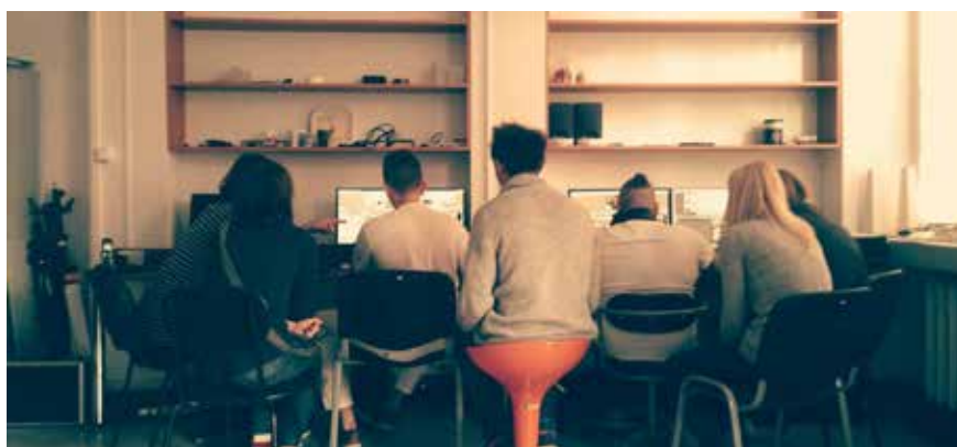
Realizatorzy telewizyjni podczas montażu