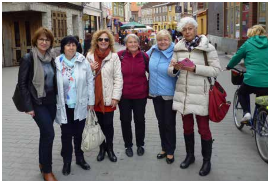
Z wizytą w Bartoszycach