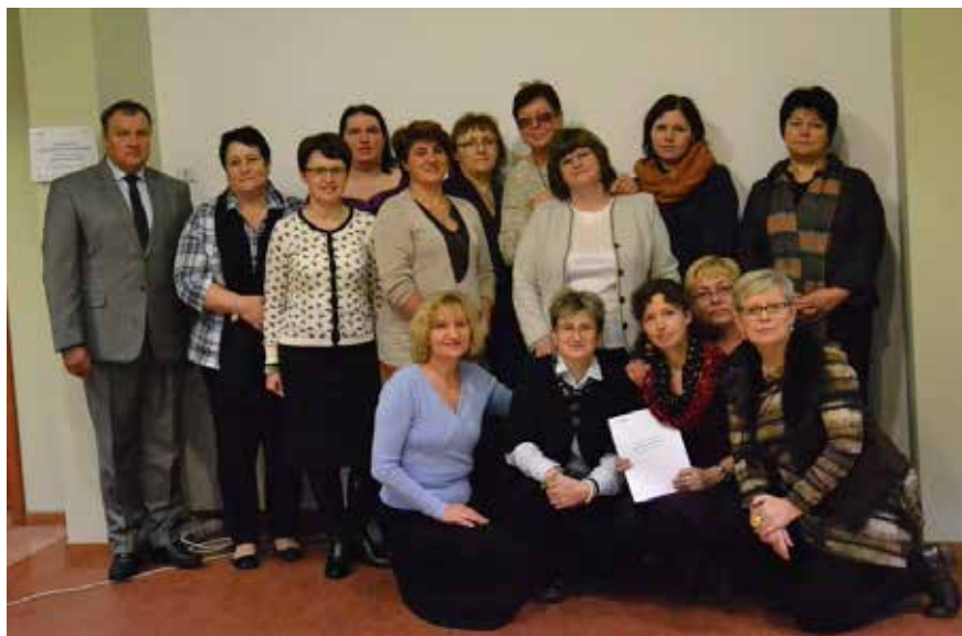
Szkolenie z komunikacji społecznej