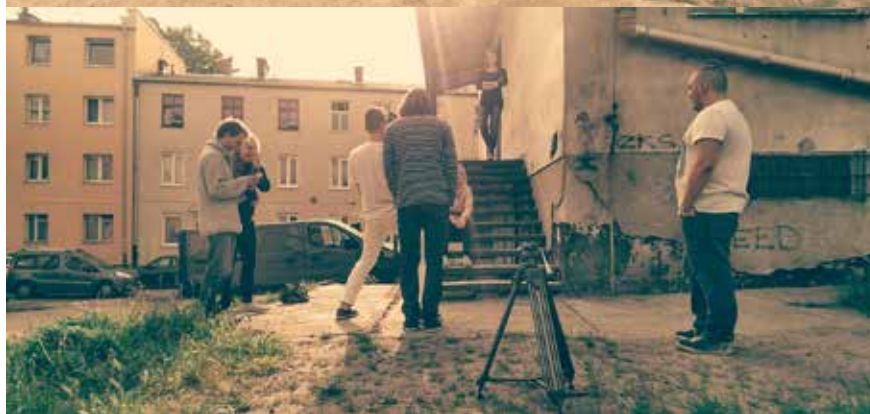
...i w trakcie kręcenia