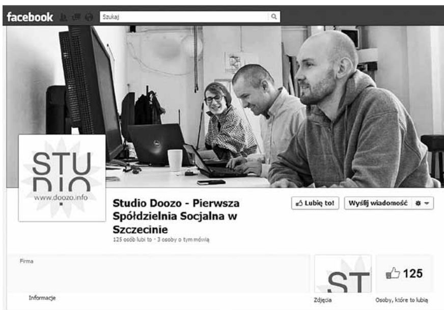
Przykład profilu szczecińskiej spółdzielni socjalnej na portalu społecznościowym Facebook

Powszechne stało się już powiedzenie „jeśli nie ma Cię w Internecie, to znaczy, że nie istniejesz”. Nie ma czasu na dywagacje, czy to prawda i na ile przekłada się w działalności przedsiębiorstwa, bo dziś „nie stać nas na nieobecność w sieci”. Internet stał się bowiem głównym źródłem informacji. Przekonać się o tym można każdego dnia – szukając przepisu na ciasto, kontaktu z najbliższą przychodnią, planu zajęć na